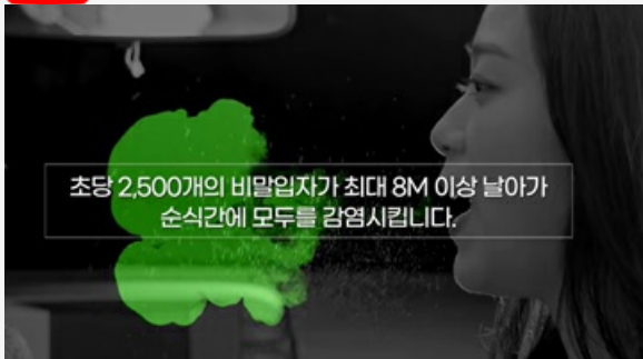
마스크를 벗는 순간